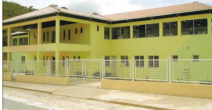
A fachada da Policlínica Municipal Dona Carmita