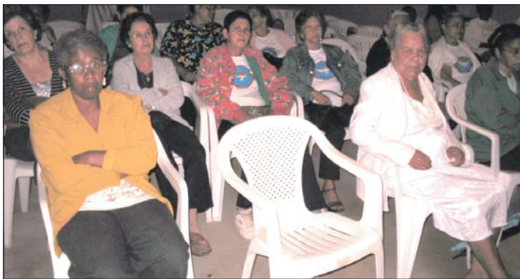
Parte do público que foi ao Asilo em 27/9, Dia do Idoso: sobram elogios para a assistência prestada à terceira idade na carta do prefeito enviada à Câmara

Noutra carta, Taquinho enalteceu a estrutura implantada, no último ano, no Asilo Municipal. "O que antes tinha como referência a casa do idoso de Rio Casca, agora tem infra-estrutura eficiente, com ampla reforma interna, implantação de serviço de fisioterapia e de sala de convivência, controle de estoque de medicamen-