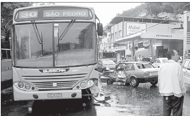
A colisão entre o Voyage e o ônibus tumultuou o trânsito

Funcionários da Secretaria Municipal de Obras