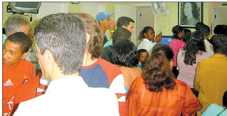
Após a solenidade, muitas pessoas foram conhecer as dependências da Policlínica Municipal