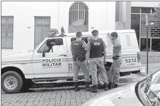
Diante do Fórum, permanência de 4 viaturas e de vários PMs durante toda a tarde

Todavia, o sargento declarou à nossa reportagem que, ao efetuar busca pessoal nos frequentadores de um bar, foi agredido a chutes e socos por Roberto e