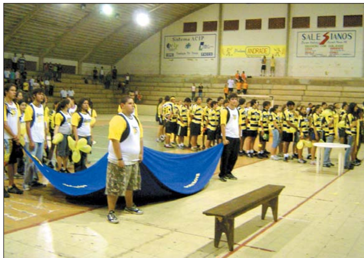
Delegações perfiladas em 11/10, na abertura da competição

A abertura oficial ocorreu no ginásio poliesportivo do ECP, com desfile das delegações das escolas que o Equipe mantém em PN e nestas cidades: Carangola, Cataguases, Divinópolis, Itaperuna, Juiz de Fora, Leopoldina, Muriaé, Rio Casca, Tocantins, Viçosa e Visconde do Rio Branco.