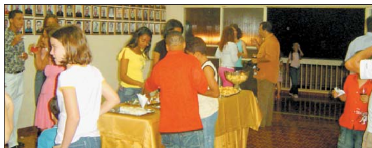
No plenário da Câmara Municipal, clima de confraternização no coquetel servido aos convidados