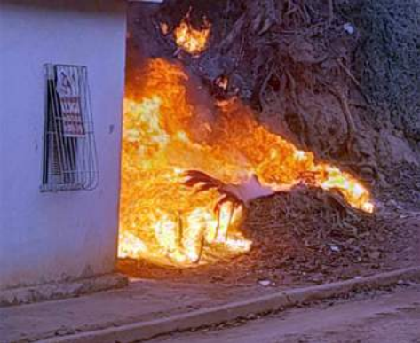
Materiais inflamáveis alimentaram o fogo

do Pontenovense Futebol Clube), sem a presença do Corpo de Bombeiros/CB. Brigadistas - Em 23/9, o CB concluiu em Urucânia Curso de Brigadista Florestal, envolvendo 13 servidores municipais treinados principalmente para combater queimadas.