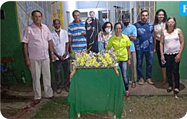
Festa do Padroeiro do Gentio