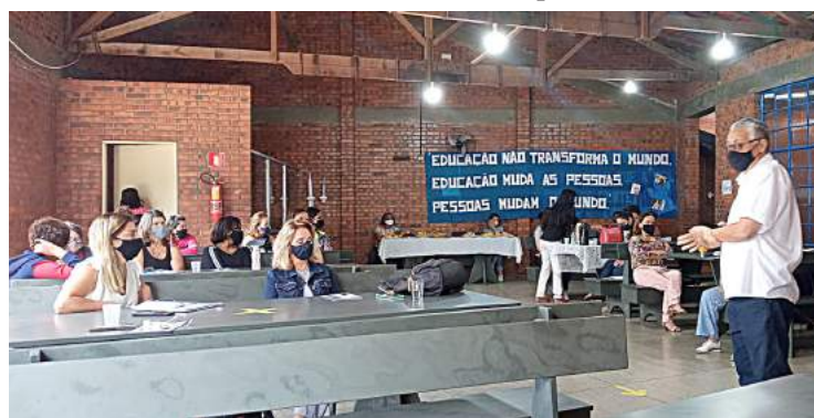
Na sede da Apae, 1º Colóquio com reflexões sobre Paulo Freire