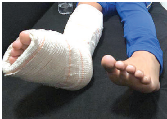
A estudante com o pé direito engessado