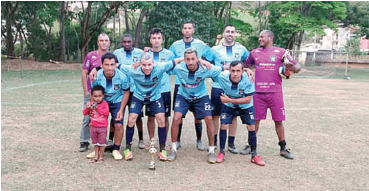
Os jogadores do Nova Era: 1º lugar