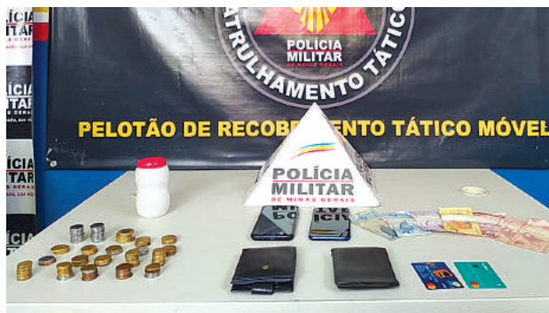
A Polícia recuperou o carro e os itens acima