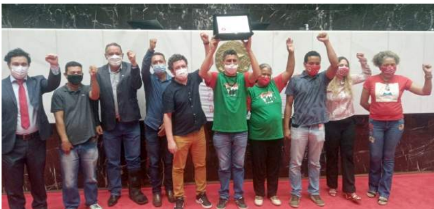
Na ALMG, a comitiva acaiaca e alguns parlamentares

dor e filósofo é considerado um dos pensadores mais notáveis na história da pedagogia mundial, tendo influenciado o movimento da Pedagogia Crítica. É também o patrono da Educação Brasileira, destacando-se como o brasileiro mais homenageado da história, com 35 títulos de Doutor Honoris Causa de Universidades da Europa e das Américas.