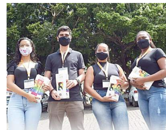
Servidores da SEMCTC entregaram folhetos no eixo Centro/Palmeiras

Em 20 e 27/9, nove dos 20 municípios confirmaram 30 pessoas com esta proporção: Alvinópolis/5, Santo Antônio do Gramma/5, Barra Longa/4, Rio Jequeri/2, Amparo do Serra, Dom Silvério, Raul Soares/1 cada.