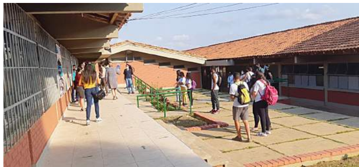
Pela rede estadual, em 27/9 retomaram-se as aulas presenciais na EE Professor Raymundo Martiniano Ferreira/Polivalente

O vereador se referiu especialmente ao acidente que matou o motoboy Tijolo (leia na página 14 ): “Na Semana do Trânsito, o que foi feito em nossa cidade? Nada de ação educativa [o Demutran, contudo, segue pintando sinalizações