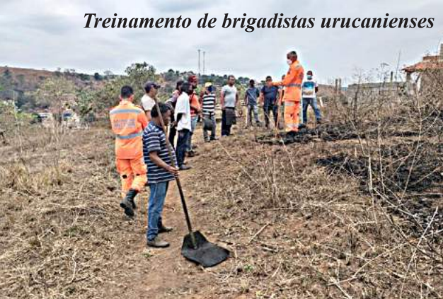
Treinamento de brigadistas urucanienses