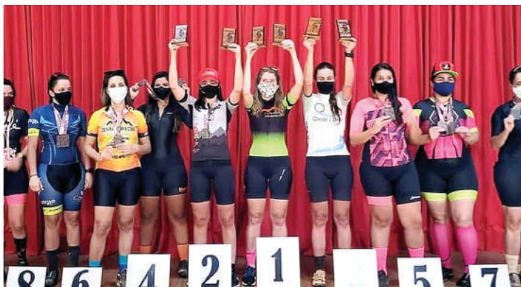
Parte dos pódios feminino e masculino