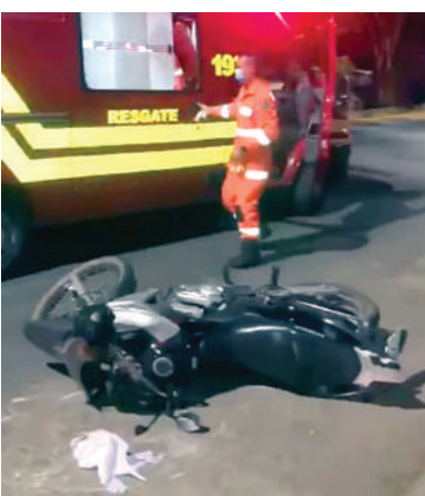
O Corpo de Bombeiros conduziu o motociclista ao Hospital Gavazza