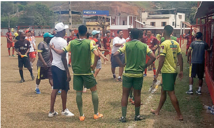
Um dos momentos tensos durante o tumulto