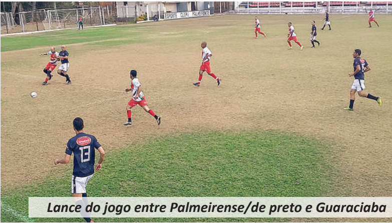
Lance do jogo entre Palmeirense/de preto e Guaraciaba