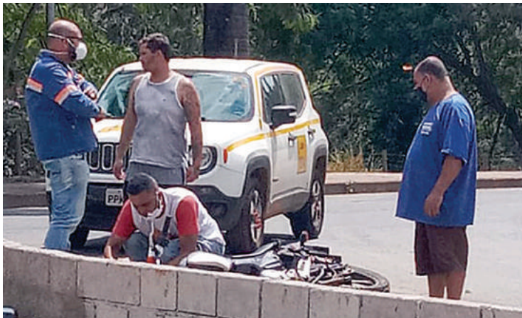
O motociclista, com escoriações diversas, foi socorrido pelo Corpo de Bombeiros

A documentação dos envolvidos estava em dia. Houve trabalho de praxe da Perícia na cena do acidente antes da liberação dos veículos.