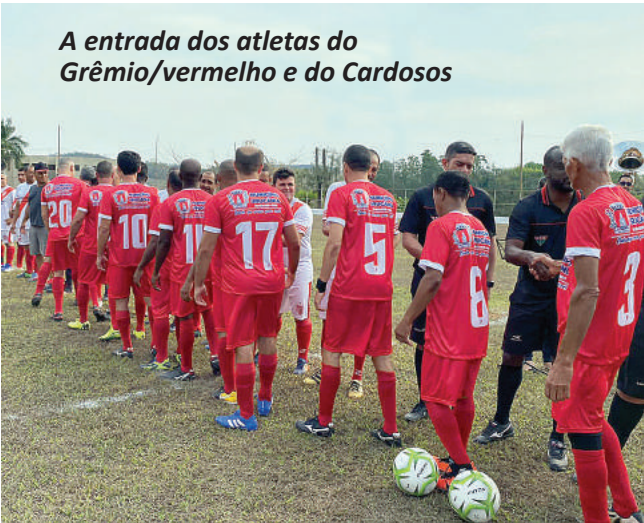
A entrada dos atletas do Grêmio/vermelho e do Cardosos