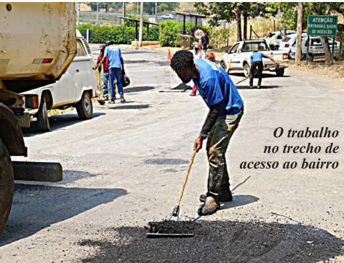
O trabalho no trecho de acesso ao bairro