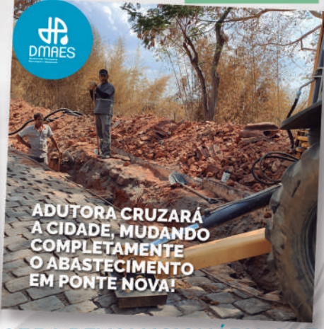
OBRA REVOLUCIONÁRIA QUE MUDARÁ O ABASTECIMENTO EM PONTE NOVA