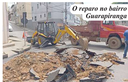
O reparo no bairro Guarapiranga