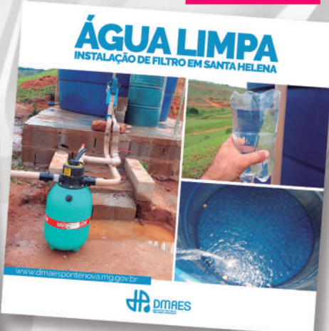
PELA PRIMEIRA VEZ, ÁGUA TRATADA EM COMUNIDADE RURAL