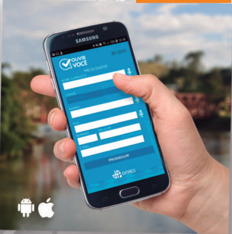
O DMAES TEM SEU PRÓPRIO APLICATIVO PARA AGILIZAR O ATENDIMENTO