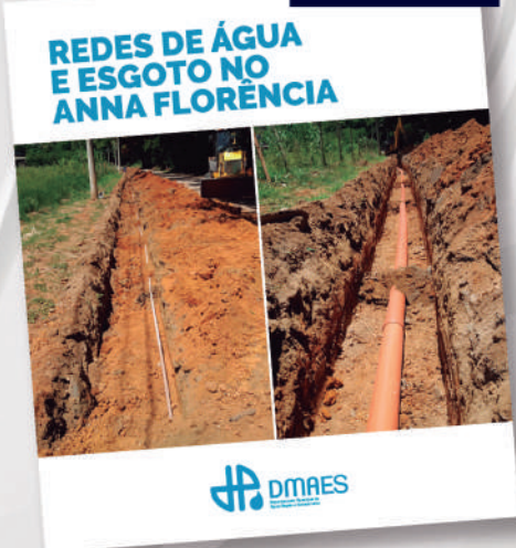
MAIS DE 1KM DE REDE NO BAIRRO ANNA FLORENCIA