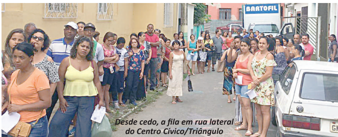
Desde cedo, a fila em rua lateral do Centro Cívico/Triângulo

E mais: "Nosso Sindicato conclama os servidores não estáveis a se inscreverem neste concurso. Na preparação dos inscritos, estamos oferecendo aulas na EM Otávio Soares/Centro Histórico com três turmas: uma de 18 a 30/11; outra de 6 a 20/12; e a próxima, entre 6 e 23/1/2020."