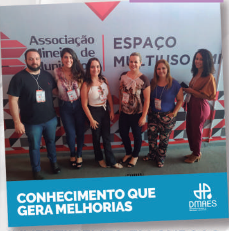
INVESTIMENTO EM CURSOS E TREINAMENTOS PARA SERVIDORES