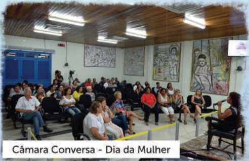
Câmara Conversa - Dia da Mulher