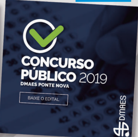
EDITAL DO CONCURSO PÚBLICO