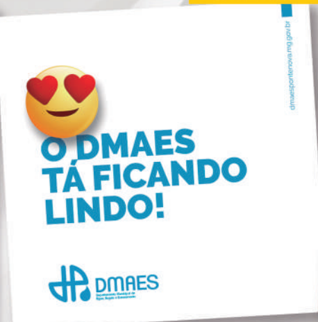
REFORMA DA SEDE ADMINISTRATIVA, QUE MELHOROU O ATENDIMENTO