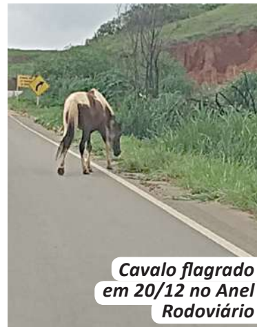
Cavalo flagrado em 20/12 no Anel Rodoviário

No site desta FOLHA, leia outras notícias afins, inclusive três delas referentes a colisão de animais com motos.