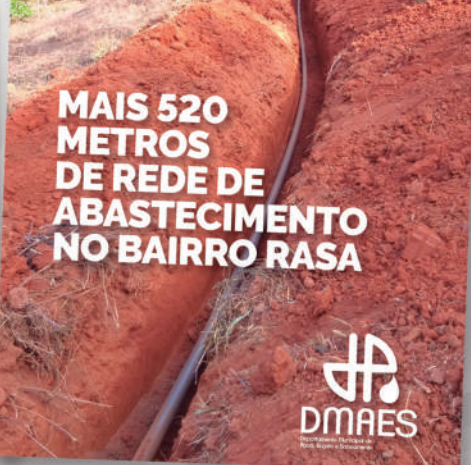
MAIS QUALIDADE NO ABASTECIMENTO DO BAIRRO RASA