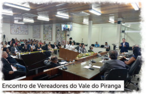
Encontro de Vereadores do Vale do Piranga