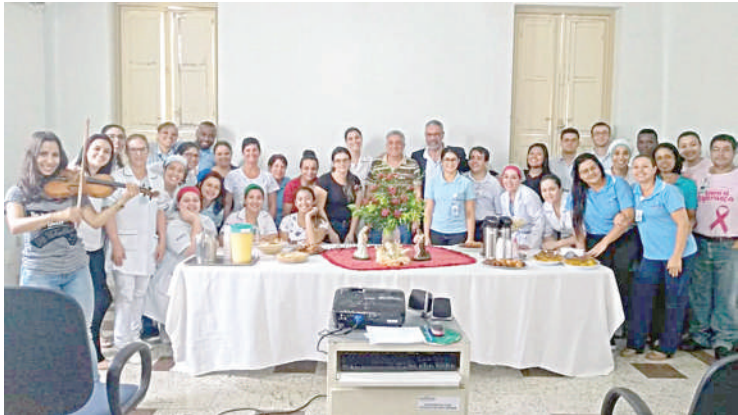
Os participantes da reunião do Grupo de Lideranças do HNSD