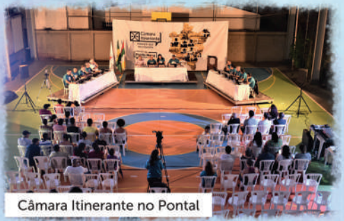
Câmara Itinerante no Pontal