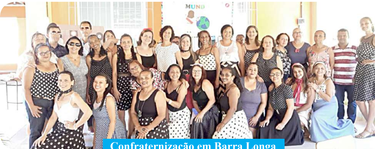
Confraternização em Barra Longa

As notas desta coluna destinam-se exclusivamente aos nossos assinantes e seus respectivos dependentes econômicos, devendo chegar à FOLHA (por e-mail ou pessoalmente) até na 2ª-feira de cada semana, no horário comercial (9h às 12h e de 13h às 17h30).