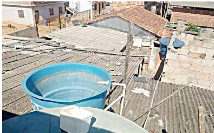
Caixa d'água destampada em Jequeri

“O controle vetorial deve ser planejado para ter execução permanente, promovendo-se a articulação com todos os setores do Município (educação, saneamento, limpeza urbana etc.). O uso de métodos sustentáveis e ecologicamente adequados, como atividades de eliminação mecânica, permite uso racional de inseticidas. Logo as ações devem ser prorrogadas como medida