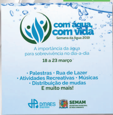
O MAIOR EVENTO DA SEMANA DA ÁGUA JÁ FEITO