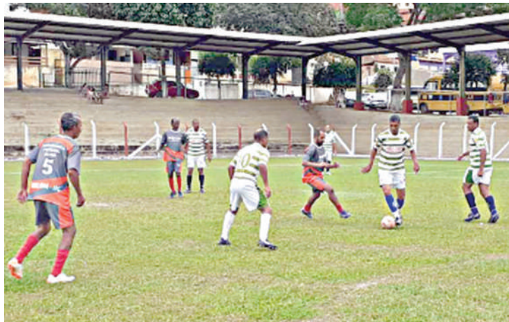
Lance da partida entre União São Pedro (de verde e branco) e Esperança