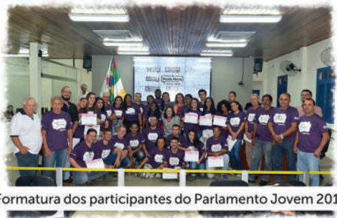
Formatura dos participantes do Parlamento Jovem 2019