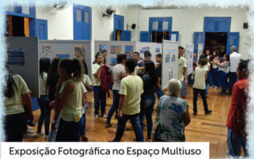
Exposição Fotográfica no Espaço Multiuso