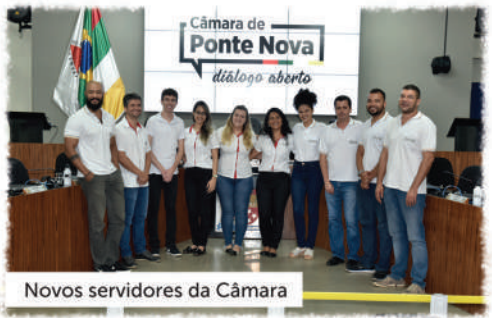
Novos servidores da Câmara

Além da instalação do jardim vertical no muro do pátio da frente da Câmara e das adequações dos espaços para receber os novos servidores e dos investimentos na aquisição e atualização de equipamentos necessários para o pleno funcionamento do Legislativo, a Mesa Diretora da legislatura 2019/2020 determinou a elaboração de projetos de engenharia e arquitetura. A ideia é melhorar a acessibilidade com a instalação de um elevador, colaborar com o meio ambiente e economizar recursos com geração de energia elétrica fotovoltaica e contribuir para preservação da memória implantando o Centro de Memória do Legislativo ainda no primeiro semestre de 2020. Os vereadores de Ponte Nova têm o compromisso de continuar trabalhando pelo crescimento e valorização de Ponte Nova e para que o respeito ao próximo e às diferenças, a tolerância, a união, o bom senso e as atitudes pelo bem comum sejam rotina em todos os dias de todos os anos na vida de todos.