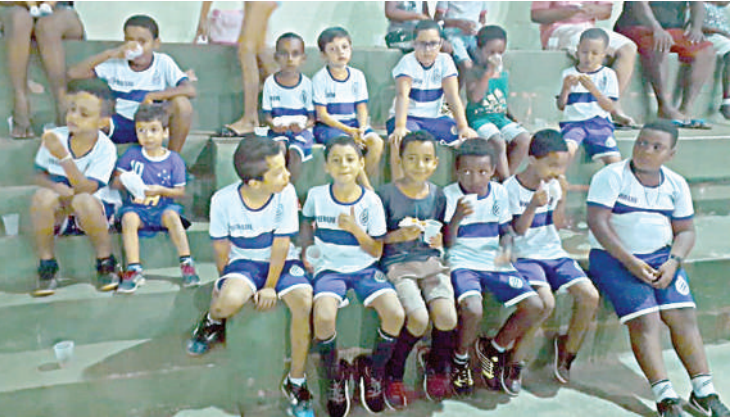
Na foto, alguns dos meninos-atletas