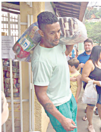
Cada cesta básica tem peso de 40kg

Geraldo Jannus ressalta: "O nosso Sindicato atua para a obtenção de ganhos