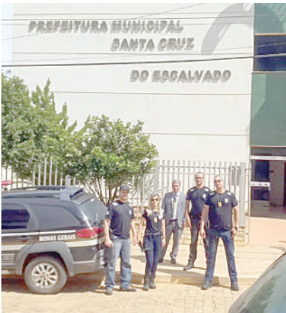
Em 26/2, atuação da Polícia Civil em Santa Cruz do Escalvado

Em outra ação, o grupo é réu num suposto esquema de fraudes em licitações investigado em três fases da Operação. O MP relatou indicativos de conluio numa sucessão de fatos