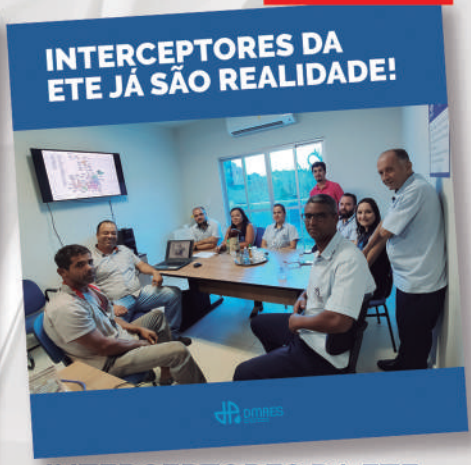
INTERCEPTORES DA ETE COMEÇARÃO A SER CONSTRUÍDOS

Estes foram apenas alguns feitos do ano de 2019. Em 2020 nossa agenda está cheia para fazer ainda mais! Com servidores competentes e comprometidos com Ponte Nova, continuaremos este legado que cria um novo conceito em saneamento para a cidade. Juntos, conquistaremos muito mais!