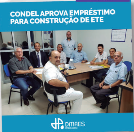
EMPRÉSTIMO VIÁVEL APROVADO PARA A ETE