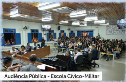
Audiência Pública - Escola Cívico-Militar