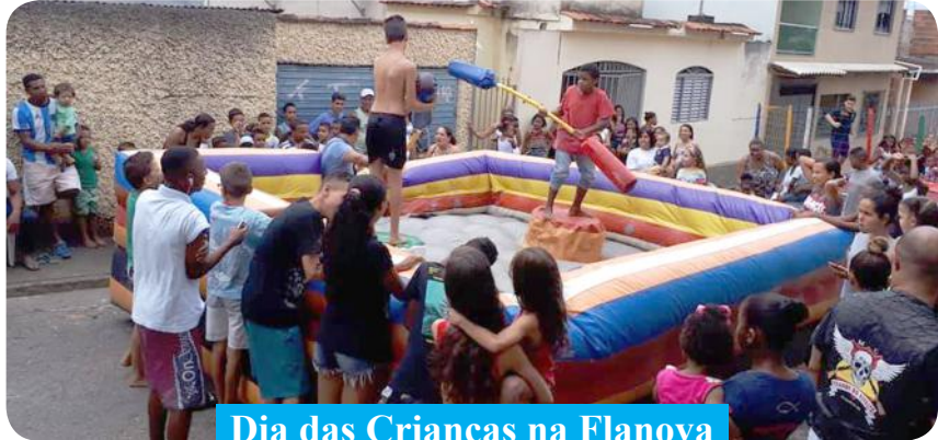
Dia das Crianças na Flanovia

A convite do Moto Clube Tiranos do Asfalto, a Embaixada do Flamengo em Ponte Nova - Flanovia/MG - esteve presente, em 12/10, na Festa do Dia das Crianças, realizada nos bairros Triângulo Novo e São Judas Tadeu, com entrega de brinquedos, balas, pipoca, refrigerantes, algodão doce etc., além de agenda de brincadeiras. A Flanovia agradece a todos que participaram dessa “linda festa, que com certeza alegrou muitas crianças de nossa cidade”.