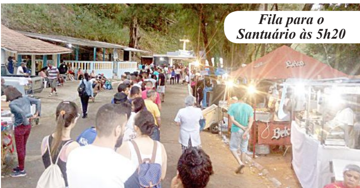
Fila para o Santuário às 5h20