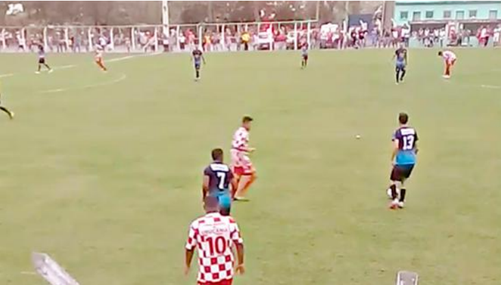
Lance da primeira partida entre Canaã e Cardosos (de vermelho e branco)