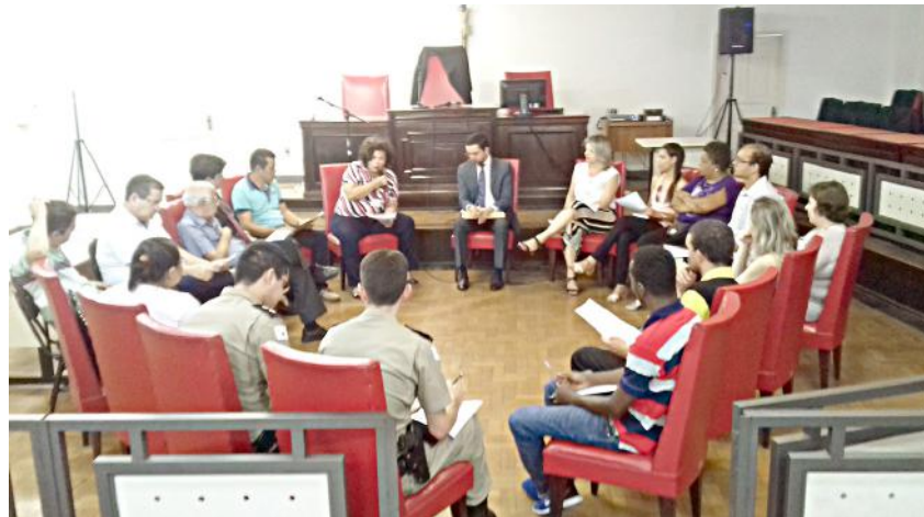
O grupo reunido na Sala de Audiências do Fórum

Sobre a causa da morte do piedadense, a SRS ainda aguarda resultados dos exames laboratoriais, a cargo da Fundação Ezequiel Dias, em Belo Horizonte.