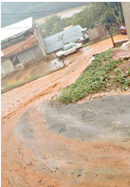
O temporal do início da tarde de ontem, quinta-feira (18/10), provocou enxurrada no bairro Copacabana

Fanica mencionou interrupção do transporte coletivo e escolar em trechos de estradas nas regiões do Brito e de Três Tiros. Ele cobrou o envio, à Câmara, de relatório de atuação da Secretaria Municipal de Desenvolvimento Rural/Sedru nas estradas vicinais.