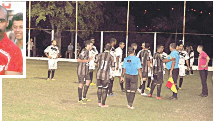
Reclamação dos atletas do Real contra a arbitragem