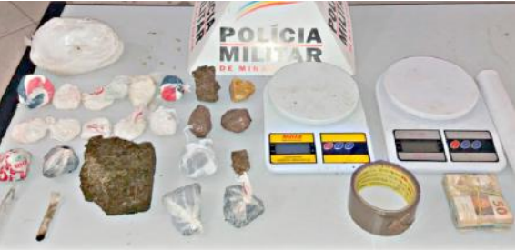
Parte dos materiais apreendidos