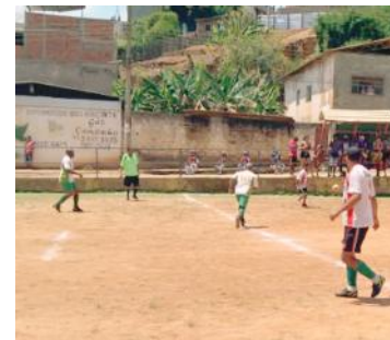
Lance da partida entre Massangano e São Pedro

Argumentando, entretanto, que o uso da cópia do documento teve autorização da LMD, a Diretoria do ECAF anunciou recurso judicial contra o ato da Junta. Para a noite de ontem, quinta-feira (18/10), previa-se reunião da Liga - na sede da Secretaria/Ponte Nova de Esportes - com dirigentes de clubes para deliberar sobre a continuidade (ou não) do certame neste fim de semana.