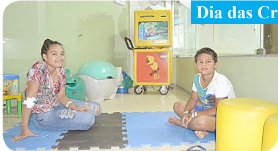
Dia das Crianças no Gavazza

A convite do Moto Clube Tiranos do Asfalto, a Embaixada do Flamengo em Ponte Nova - Flanovia/MG - esteve presente, em 12/10, na Festa do Dia das Crianças, realizada nos bairros Triângulo Novo e São Judas Tadeu, com entrega de brinquedos, balas, pipoca, refrigerantes, algodão doce etc., além de agenda de brincadeiras. A Flanovia agradece a todos que participaram dessa “linda festa, que com certeza alegrou muitas crianças de nossa cidade”.