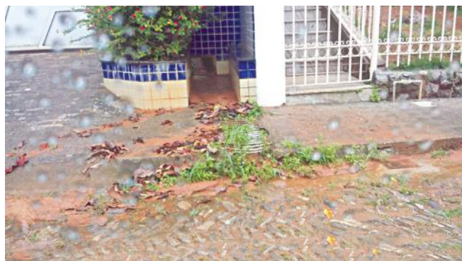
Na rua Sinésio Moreira dos Santos, a enxurrada volta pelo bueiro

Fiota/Patriota referiu-se a estradas patroladas, mas sem cascalhamento, nas localidades de Boa Vista, Caiana e Serra dos Pinheiros.