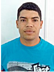
Moço de Rio Casca