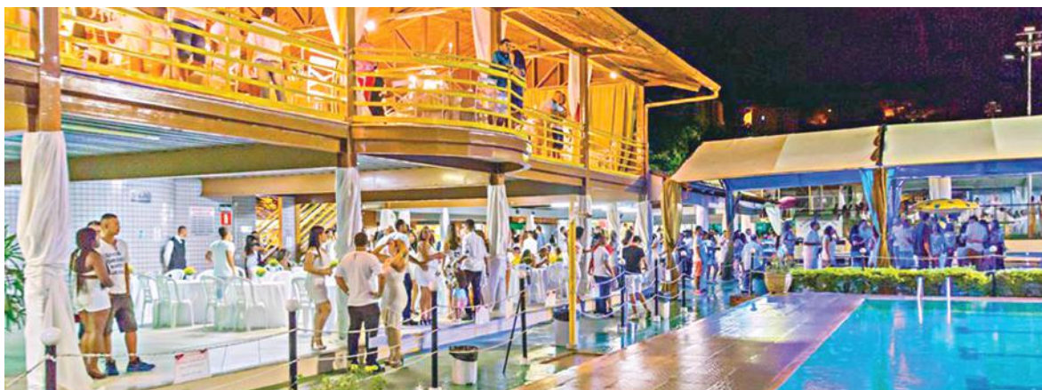
As festas de Réveillon do EC Palmeirense já estão no calendário de fim de ano de Ponte Nova. O projeto é aprimorado ano após ano com aprovação geral das famílias associadas e dos convidados