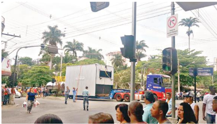
A passagem de uma das carretas em Palmeiras