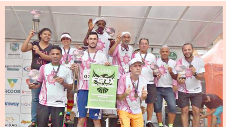
No pódio, os atletas do Fênix sem Fronteiras