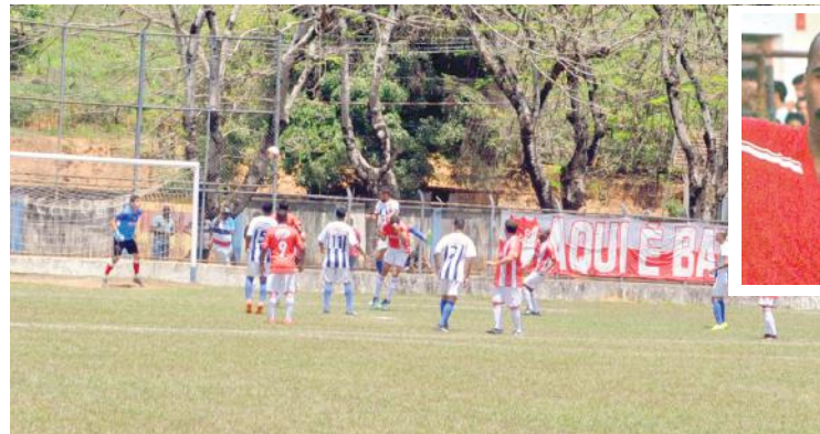
Lance do jogo contra o ECAF, no qual o PFC respeitou luto pela morte, em 15/10, de seu ex-atleta Deka Zueira (foto ao alto)

Resultados da 5ª rodada, ocorrida em 14/10: Flamenguinho 3 x 1 União Raposo, Massangano Show 2 x 1 São Pedro, Novo Horizonte 3 x 2 Cidade Nova, Cruzeiro do Kuxixo 1 x 0 Campinho Atlético C, Amigos do Luciano 5 x 1 Treze do Bairro de Fátima e Triângulo Novo 12 x 3 Veteranos.