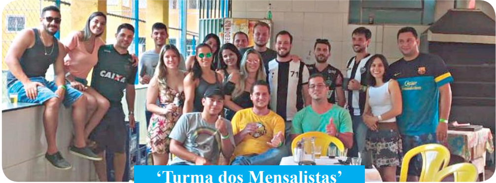
‘Turma dos Mensalistas’

com atividades na Brinquedoteca para os pequenos hospitalizados. Houve sessões de cinema com lanches especiais e brincadeiras com as monitoras. Esclarece a nota: “A Brinquedoteca é um espaço lúdico estruturado para os pacientes pediátricos internados. Com as atividades, eles têm a possibilidade de resgatar momentos prazerosos do dia a dia. Brincando, as crianças têm suas tensões diminuídas, o que colabora para uma boa e rápida recuperação. As atividades lúdicas também propiciam a criação de vínculo entre a criança, a família e a Equipe de Saúde, frente aos processos de humanização hospitalar.”