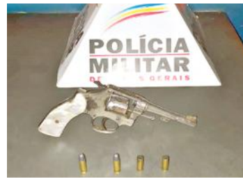
A arma apreendida

Sabe-se que o de 15 anos chamou o oponente para a rua e este se dispôs a “conversar