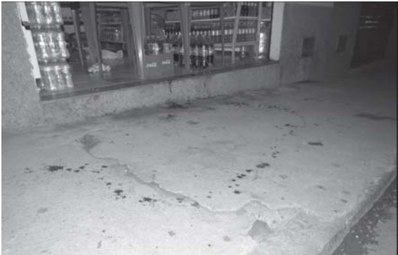
No passeio, marcas do sangue do comerciante

No dia seguinte, ao pesquisar imagens de câmeras de segurança de lojas vizinhas, investigadores da Polícia Civil identificaram os autores, havendo imediatamente mandado judicial de acautelamento de ambos.