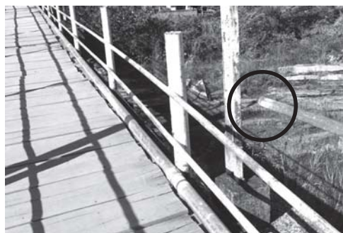
No círculo, tubo de cano rompido na passarela

A reportagem desta FOLHA constatou piso com madeira solta e ferrugem e falta de barras em boa parte do parapeito, bem como rachaduras na estrutura da antiga ferrovia. "Estão esperando acontecer uma tragédia para tomarem providências", disse um morador das imediações.