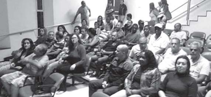
Parte do público na assembleia de 20/5

Em ‘banho-maria’ “Soubemos de fontes seguras que o receio do prefeito era [que houvesse] protesto dos servidores no Dia da Cidadania [7/5]”. Para a entidade sindical, a declaração do chefe do Executivo sur-