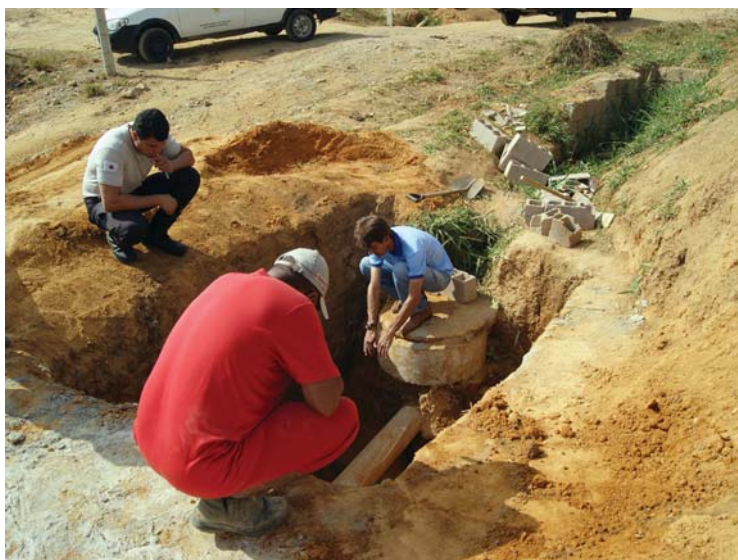
No início do ano, pessoal do Dmaes trabalhou na caixa separadora de resíduos, no acesso à Penitenciária