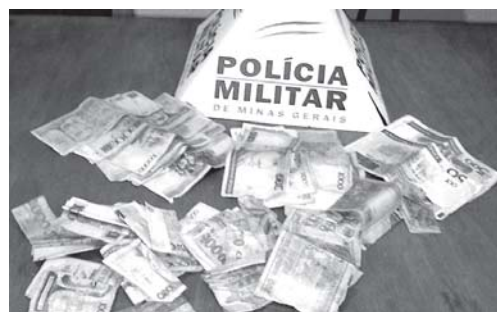
As cédulas antigas