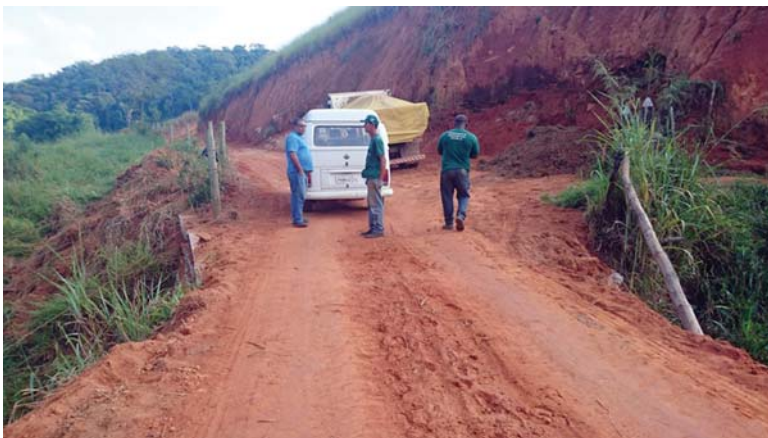
Em foto de 9/5, a Sedru divulgou a recuperação de ponte em Dioguinho. Dias depois, houve melhorias no acesso à localidade Pimenta