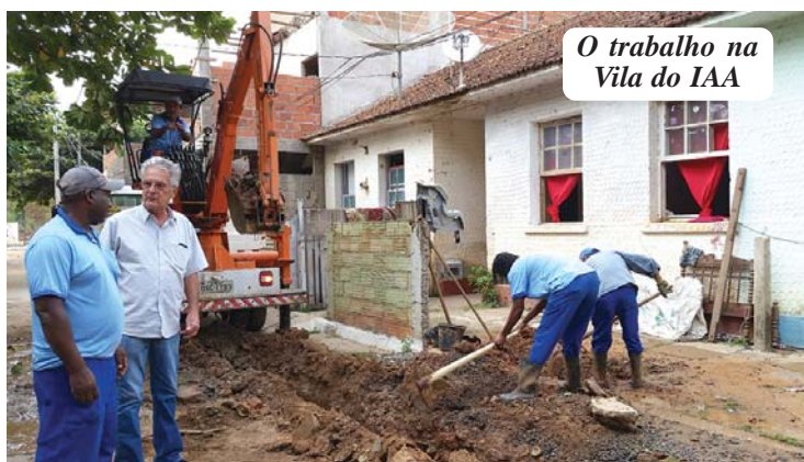
O trabalho na Vila do IAA

- Não se construíram interceptores de esgoto na Vila Oliveira até o rio Piranga, o que degrada o trecho urbano do ribeirão Vau-Açu; não há reciclagem do lixo; a estrada, transformada em avenida [com asfalto de baixa qualidade], não tem iluminação nem placas alertando para a travessia de animais; e faltam estudos de impacto ambientais e de vizinhança para outras compensações.