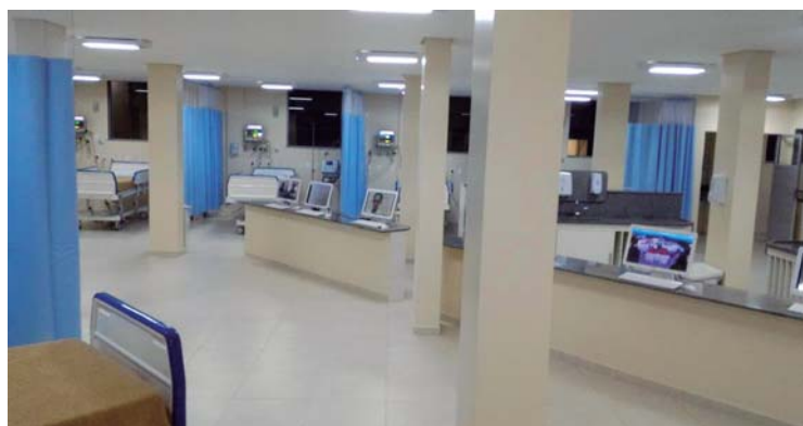
Vista parcial dos leitos do CTI

dos com tecnologia de ponta e expectativa de nova etapa com mais três leitos semi-intensivos. O orçamento da obra é de cerca de R$ 1,1 milhão - recursos próprios, doações da família