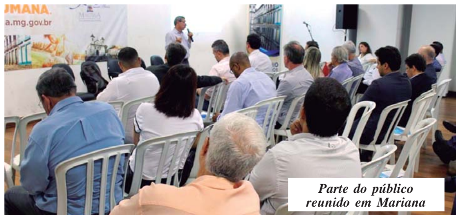
Parte do público reunido em Mariana