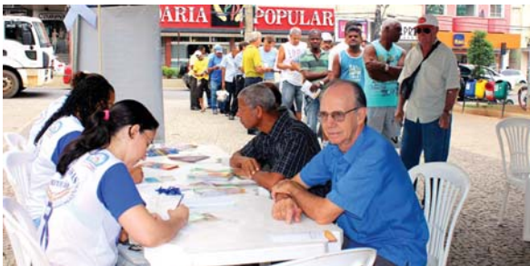
Coleta de dados pessoais para os exames de PSA