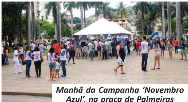
Manhã da Campanha 'Novembro Azul', na praça de Palmeiras