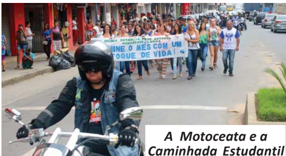
A Motoceata e a Caminhada Estudantil