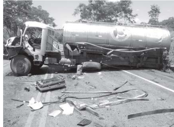
O Logan e o caminhão: o acidente interrompeu o tráfego na BR