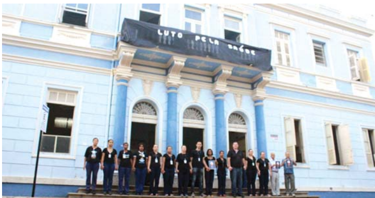
Usando camisetas negras, o protesto de dirigentes e funcionários do HNSD (à frente do prédio centenário) e do HAG (diante de uma das portarias)

O motivo oficial do MS é a insuficiência orçamentária, o que, segundo informe da Federassantas, “gera riscos de descontinuidade dos serviços”. Daí a decisão por manifestações pacíficas a partir deste início de mês denunciando “o descaso com as instituições filantrópicas, responsáveis por mais de 70% do atendimento do SUS no Estado”, como informa nota da Federassantas.