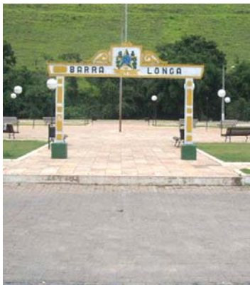
A praça afetada: antes da tragédia e durante o dia 6/11

que a coisa estava feia desde Mariana. Entre uma conversa e outra, levei meus filhos para um local seguro”, revela ela.