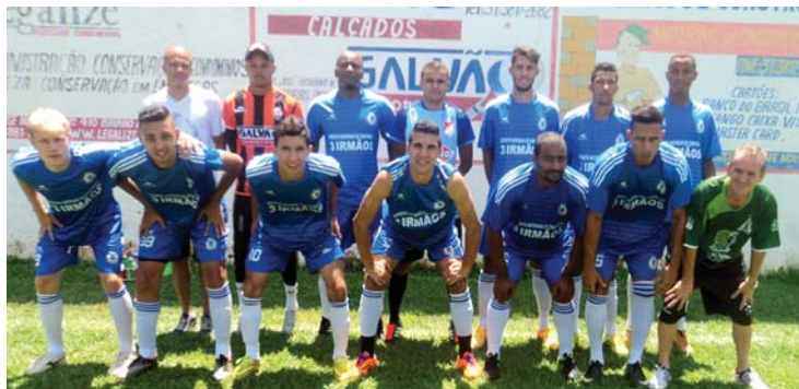
Os integrantes da RJ: classificados ao golear o time de Copacabana

Neste domingo, 6/12, enfrentam-se, a partir das 9h, Pacheco x Amigos da Base e América x RJ Empreiteira. Em 13/12, os confrontos serão estes: Vila Oliveira x São Pedro e São Lourenço x Copacabana.