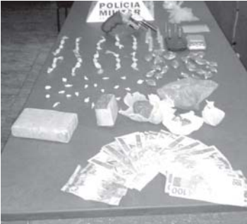
Os itens apreendidos

Às 18h30 de 8/1, duas equipes do Tático Móvel apreenderam, na casa de W.D.S., 21 anos, no bairro de Fátima, os seguintes materiais: celular, 28 buchas de maconha, 21 pedras de crack, 6 tabletes de maconha (que, depois de subdivididos, renderiam aproximadamente 1.052 buchas), 30 papelotes de cocaína, saquinhos plásticos e balança de precisão.