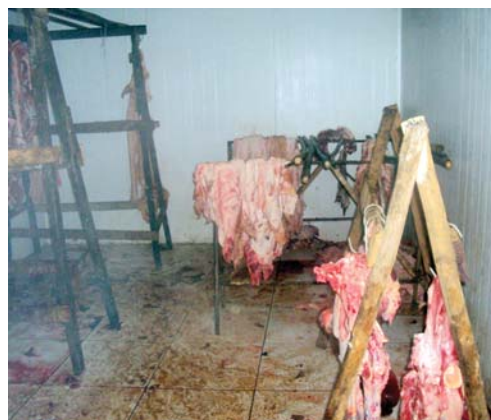
... e armazenamento de carcaças bovinas e suínas