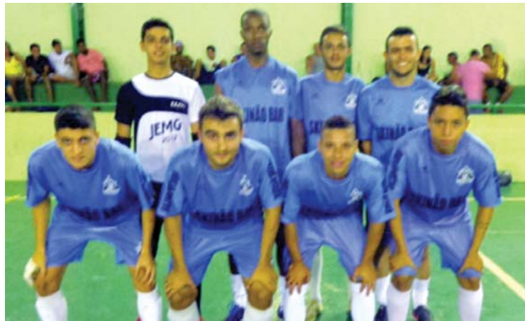
O time urucaniense venceu o Beys F.C (PN) na noite de estréia

A próxima rodada acontece hoje, 16/1, a partir das 19h30: Parceiros Futebol Clube x Panathinaikos e Lelé Futebol Clube x Beys FC.