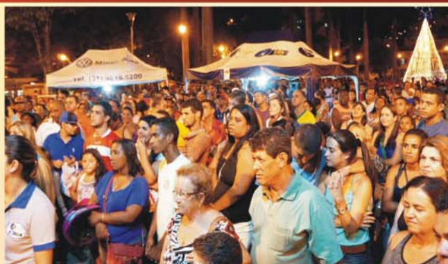
A Praça de Palmeiras recebeu grande público para o segundo sorteio da promoção, realizado no dia 8 de janeiro