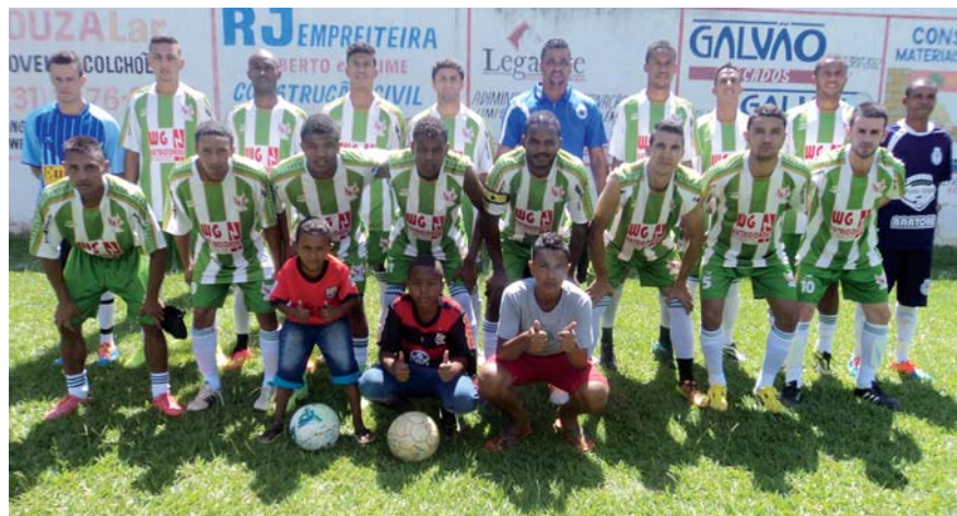
O time do São Pedro superou a derrota do 1º jogo vencendo a Vila Oliveira no tempo regulamentar e nos pênaltis