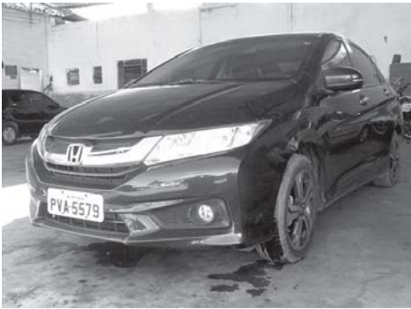
O carro do advogado foi abandonado na fuga

Neste endereço, depois de render dois pintores que trabalhavam na reforma, o trio fugiu transportando o cofre (com valores não informados) no porta-malas do carro do advogado e levando este como refém. A PM apurou que um assaltante saltou do carro, ainda naquele bairro, e entrou num veículo Corola (placa não anotada) seguindo para a BR-262. Com o alarme, houve bloqueio no entorno da cidade e nas rodovias próximas. Mais tarde, o Honda City foi localizado em estrada rural do muni-