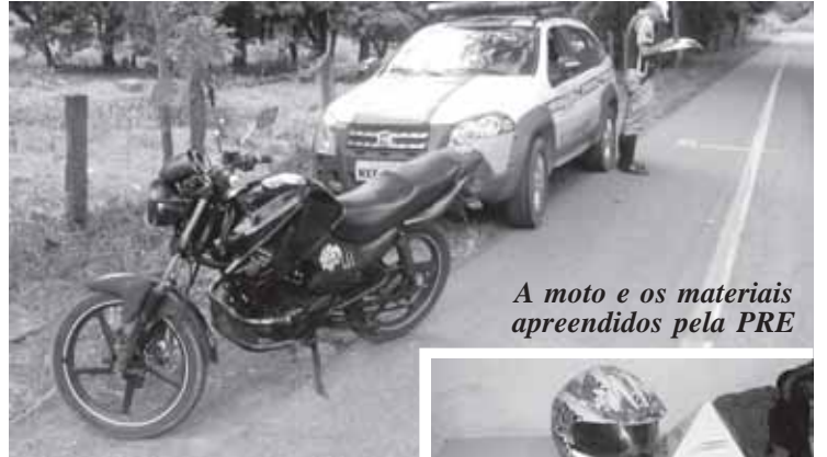
A moto e os materiais apreendidos pela PRE

Os militares apreenderam a moto de H.H.B., com este admitindo a compra da droga de desconhecido no bairro São Pedro/PN, para uso próprio, não para venda. Na Delegacia/PN, o rapaz acabou obtendo a condição de responder ao inquérito em liberdade.