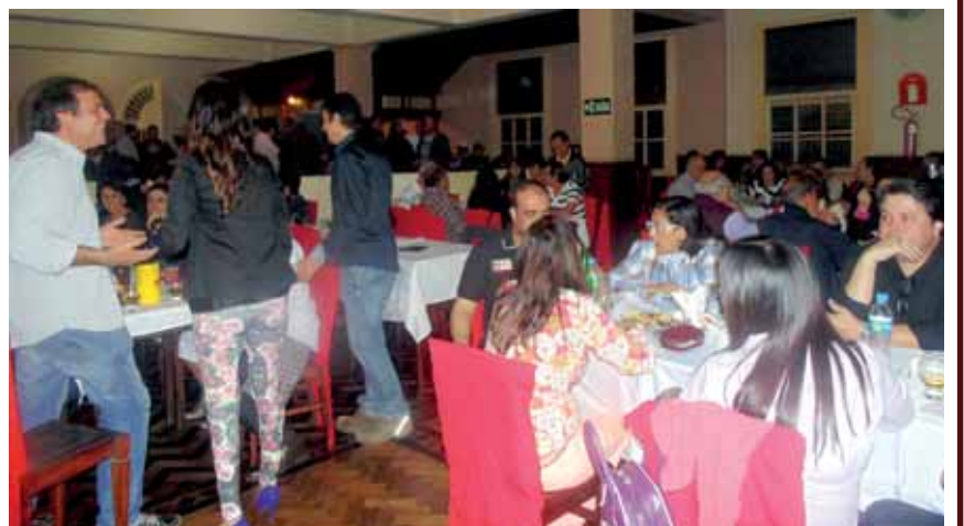
Parte do público que prestigiou o evento