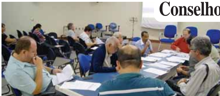
Conselheiros reunidos em 2/6: quatro 'ensaios' de correção

- A 3ª, com 7.200km, passa por 2 localidades para acesso a estas escolas: EE Bias Fortes e EM Miquelina Martino Moreira dos Santos/Centro.