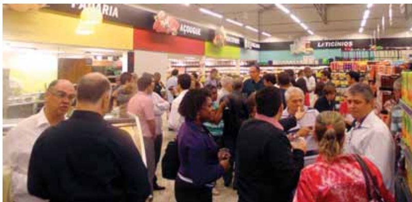
Flagrante do coquetel de pré-inauguração, na noite de 29/5