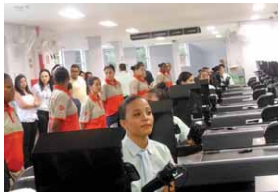
Funcionários na expectativa da inauguração