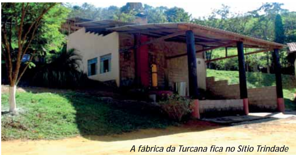
A fábrica da Turcana fica no Sítio Trindade