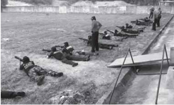
Policiais de PN no grupo que praticou tiro ao alvo