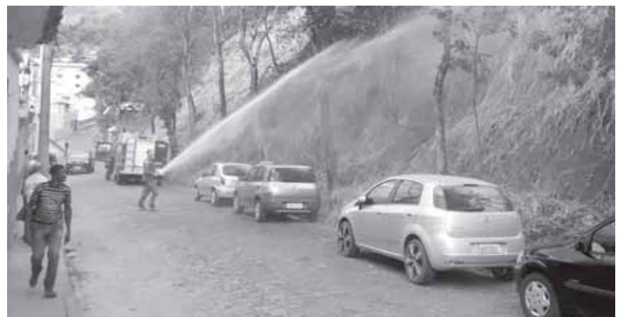
Bombeiros agiram rápido para evitar que o fogo atingisse os veículos

Por volta das 16h30 de 29/5, militares do Corpo de Bombeiros/PN apagaram incêndio em mato seco de terreno baldio da rua Cantídio Drumond/Centro Histórico. O fogo chegou a ameaçar veículos estacionados, com os bombeiros usando técnica de resfriamento dos carros enquanto atacavam os focos das chamas.