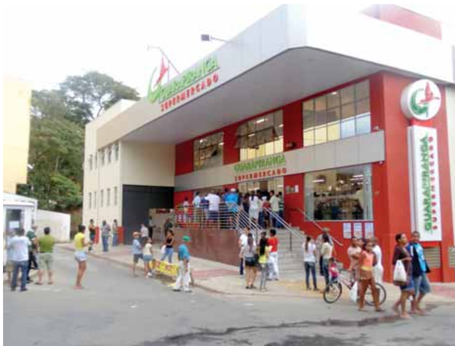
A fachada da loja, na área central do bairro Triângulo