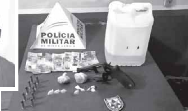
Lequinha assumiu a propriedade destes itens

Ao identificar o condutor - Alex Almeida Lopes, 21 anos (Lequinha/foto), do bairro de Fátima, e o carona, um adolescente de 17 anos, do São Pedro -, os PMs não encontraram nada de ilícito com ambos. Todavia o menor estava “bastante inquieto” - como descreve o boletim da PM - e acabou admitindo a posse de droga em casa. No quarto dele, os militares localizaram num colchão 2 pacotes plásticos com maconha, a qual, dividida para consumo, renderia até 20 buchas. Já na casa de Alex, os militares encontraram revólver calibre 38, 10 munições deste calibre, 15 papetes de cocaína e frasco com cerca de 1 litro do entorpecente “cheirinho da loló”. Ao