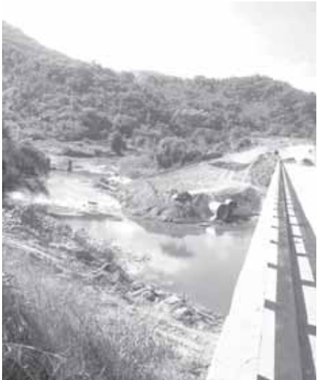
A obra da variante em foto de 3/6

ponte do Gualaxo/km 46 da MG-262 poderá ser concluída neste fim de semana (7 e 8/6), permitindo passagem de veículos leves, ônibus e caminhões. “No entanto não será permitida a circulação de carretas e tremi-nhões por este ponto”, acrescenta a nota. O prazo oficial de conclusão é o dia 12/6. O DER ainda informa que, após estudos técnicos na ponte afetada, mantém-se a sua interdição total, “por questão de segurança”, até a conclusão dos “serviços necessários para livre circulação”.