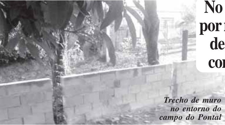
Trecho de muro no entorno do campo do Pontal

Ligue 3817-1716 e faça já a sua assinatura!