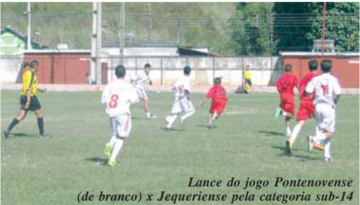
Lance do jogo Pontenovense (de branco) x Jequeriense pela categoria sub-14