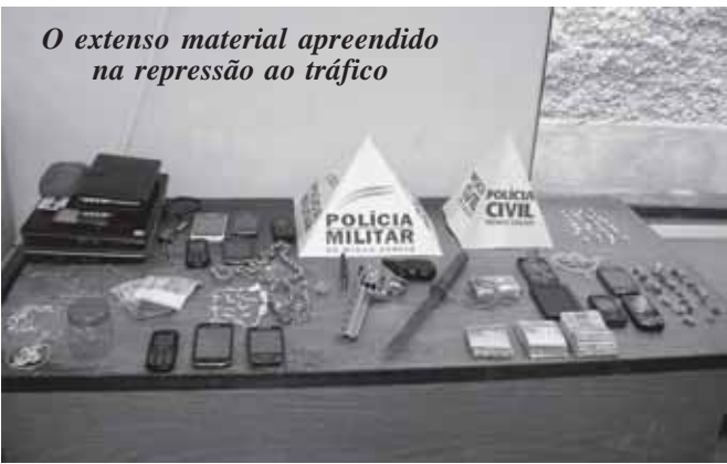
O extenso material apreendido na repressão ao tráfico

RIO CASCA - As Polícias Civil e Militar divulgaram nesta semana o balanço geral da operação de repressão ao tráfico de drogas desencadeada em 29/5, no bairro Cruzeiro (ele saiu resumido em nossa edição passada). Foram apreendidos cerca de R$