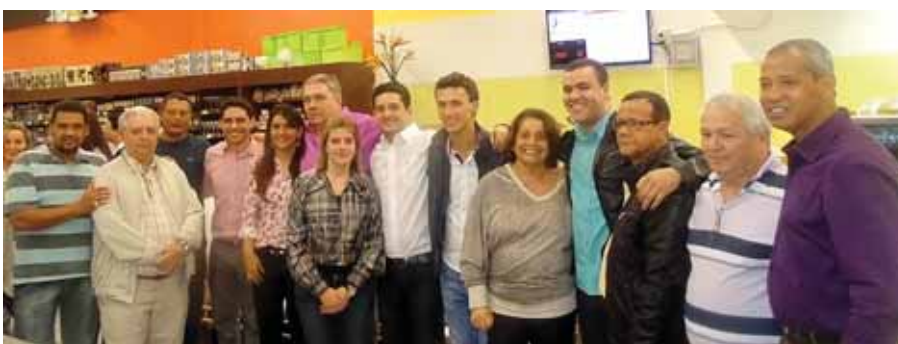
Integrantes da Família Duarte com vereadores pontenovenenses