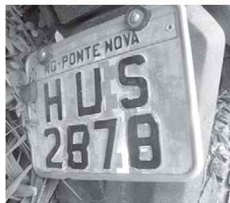
Quando a moto foi localizada, estava com a placa adulterada (acima)

disse que determinou diligências até a localização de Landinho, o que ocorreu “graças ao bom trabalho investigativo de nossa equipe”. Segundo a Polícia Civil, possíveis vítimas de Landinho podem procurar a Delegacia/PN para encaminhamento de novas denúncias.