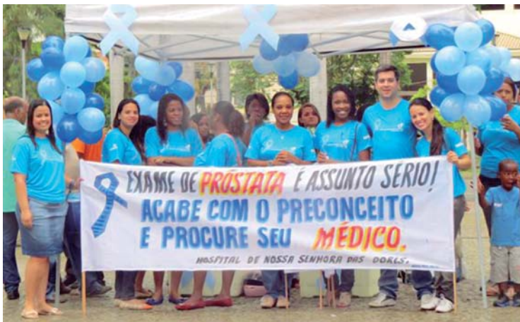
Representantes do HNSD na praça de Palmeiras