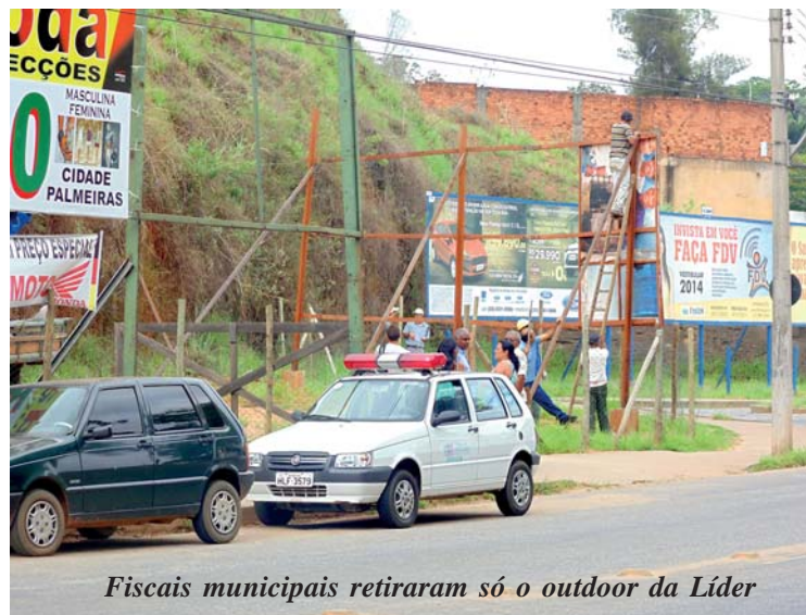
Fiscais municipais retiraram só o outdoor da Líder

Este deu declarações na semana anterior creditando o ato à suposta atitude do Governo Municipal [rechaçada pela Chefia do Executivo] de intimidar postura crítica manifestada na Rádio Montanhês AM e no Jornal Líder Notícias.