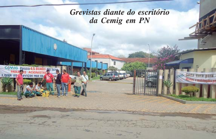
Grevistas diante do escritório da Cemig em PN

nal “Estado de Minas”, a Assessoria da Cemig informou que vem negociando com os diversos Sindicatos representativos de seus empregados, considerando o momento atual do setor elétrico nacional e “sentença normativa que regula as relações trabalhistas”. Para a empresa, “pequeno número de empregados pararam, mas os serviços continuam sendo prestados, sem comprometer o fornecimento de energia e o atendimento aos clientes”.