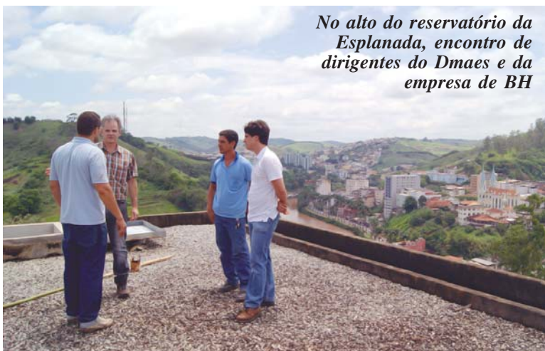
No alto do reservatório da Esplanada, encontro de dirigentes do Dmaes e da empresa de BH

O reservatório local, com capacidade 1 mi-