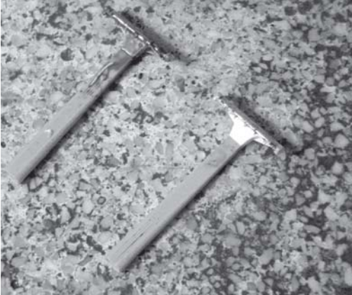
Os aparelhos de barbear apreendidos