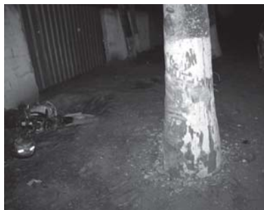
Jurandir chegou a ser socorrido com suspeita apenas de acidente, mas a Polícia Civil ainda apura se ele foi executado enquanto pilotava a moto