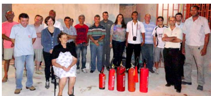
Moradores e lojistas reunidos em treinamento, inclusive numa demonstração de combate ao fogo

O Residencial Palmeiras é o primeiro condomínio em Ponte Nova a passar por esse tipo de treinamento e também o primeiro a ter a documentação e o funcionamento liberados pelo Corpo de Bombeiros, com o empenho e a parceria das empresas SOS Prestadora de Serviços (que administra o condomínio) e PREVER Engenharia , que elaborou o projeto de prevenção de incêndio e pânico.