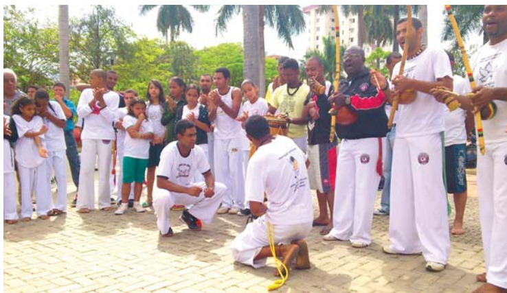
A apresentação na praça de Palmeiras

- 30/9, na praça do Pacheco, mais apresentações culturais e o encerramento, já na EM Progresso, com almoço de confraternização.