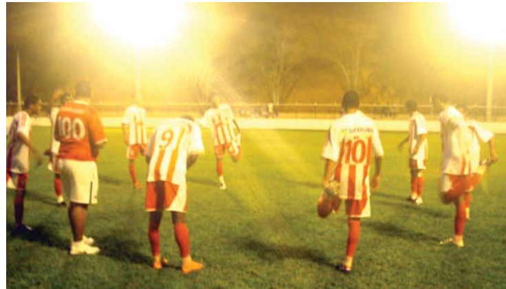
Em 14/10, o aquecimento de atletas de Rio Doce