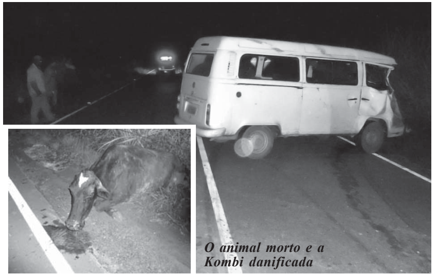
O animal morto e a Kombi danificada

De acordo com o sargento Gláucio Brasilino/PRE, a falta de manutenção de cerca em propriedades à beira de estradas facilita a fuga de animais. É dever dos proprietários rurais - continua o sargento - limpar os pastos e manter aceiros para evitar que eventuais incêndios danifiquem as cercas, facilitando a fuga do gado. De outro lado, conforme o sargento, cabe aos condutores dirigir atentamente à noite, horário mais comum de acidentes envolvendo atropelamento de animais.