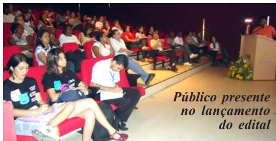
Público presente no lançamento do edital