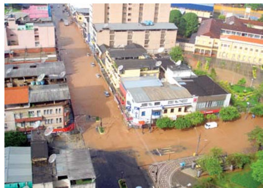
Com topografia acidentada e seu centro à beira do rio Piranga, Ponte Nova tem muitos problemas ambientais, a exemplo deste alagamento no centro de Palmeiras, em fev/2008

O objetivo é ampliar as discussões e promover o debate em torno da análise e da votação do projeto, além de ouvir