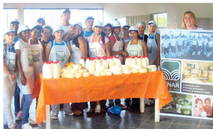
Processamento de Queijo em Miradouro