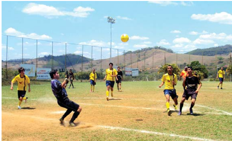
Lance do jogo Gráfica Bartofil (uniforme preto) 8 x 6 Padaria Popular, em 12/10, pelo torneio do Primeiro de Maio