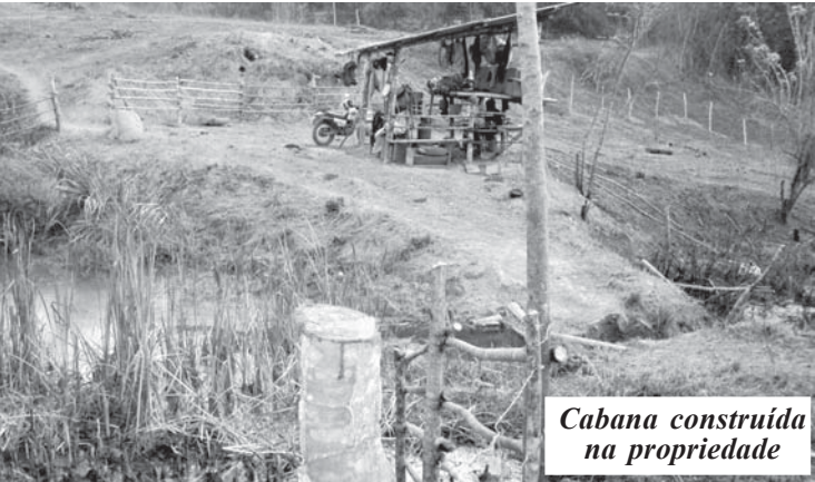
Cabana construída na propriedade