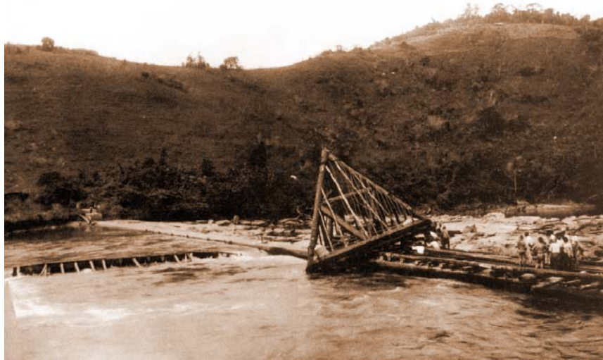
O triedro que foi lançado no Piranga para reparar fenda na Usina do Brito