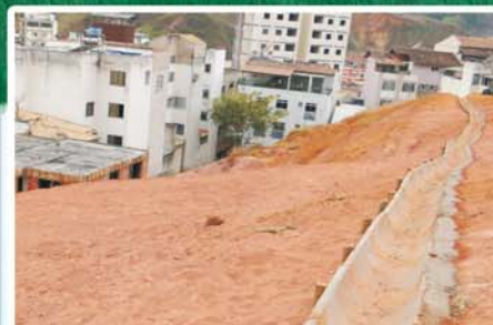
Drenagem e contenção de barranco na rua Carlos Marques, no bairro Guarapiranga