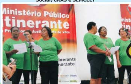
Ministério Público Itinerante em Ponte Nova