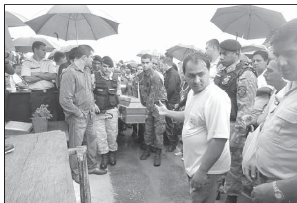
No sepultamento, luto em solidariedade