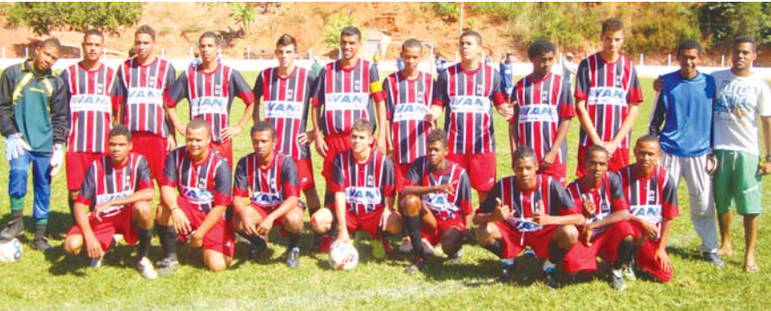
Estes são os atletas e dirigentes do time do Pontal na rodada de estreia da Copa