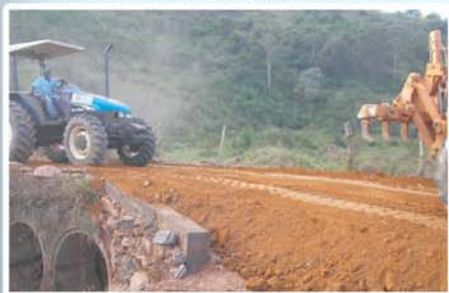
Melhoria e manutenção de dezenas de quilômetros de estradas rurais