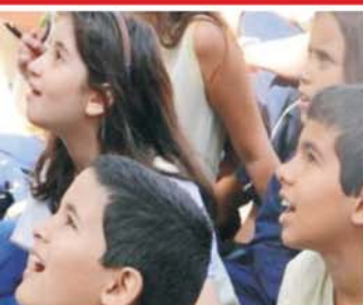
Cineco: implantação de minissala de cinema. Ação conjunta das Secretarias de Cultura, Esporte, Lazer e Turismo e de Educação em parceria com a Novelis