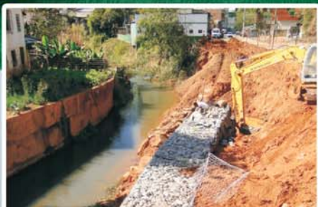
Recuperação de erosão às margens do ribeirão Vau-Açu, no Gavetão e na Vila Oliveira