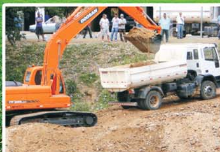
Respeito ao meio ambiente: retirada de entulhos da margem direita do rio Piranga até a ponte da Barrinha