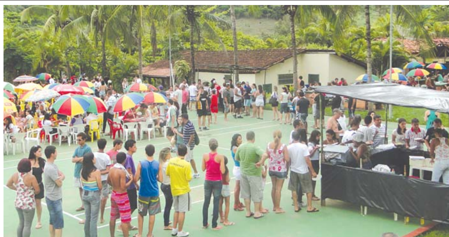
O público que prestigiou mais esta linda festa de confraternização macuca