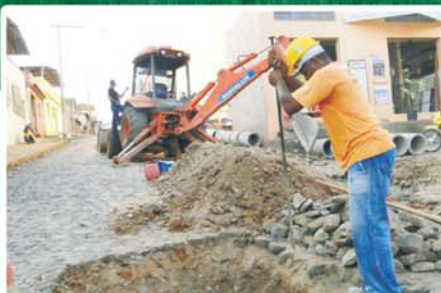
Infraestrutura e asfaltamento da rua José Galdino Vieira, no Pacheco