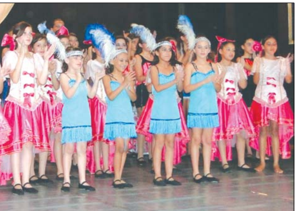
rocando cada ingresso por 1 brinquedo novo.