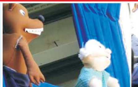
Biblioteca Volante do SESC em praça pública