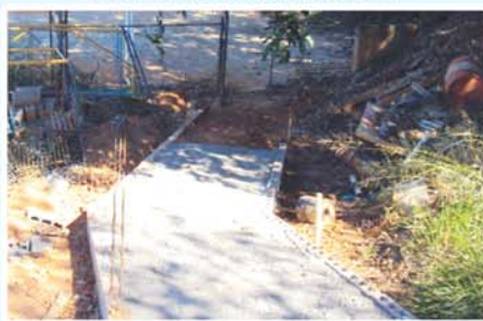
Construção de passarela interligando a sede da APAE e quadra poliesportiva