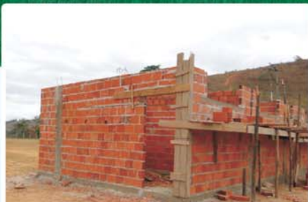
Construção de vestiário no campo do Carecô, no bairro São Pedro