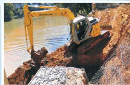
Recuperação de cais na av. Arthur Bernardes, na beira-rio