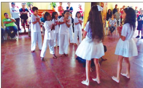
Crianças durante jogral sobre a paz: não ao bullying