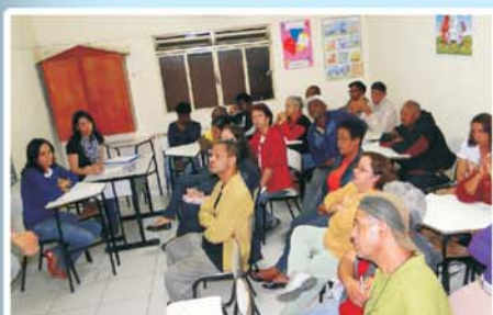
Conferência do Plano Diretor: os cidadãos mostram necessidades para o desenvolvimento