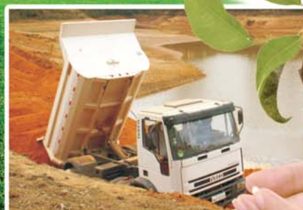
Obra por toda a cidade e recuperação do Parque Florestal Passa-Cinco