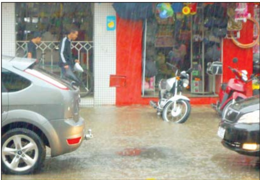
Enxurrada no centro de Palmeiras em 23/11: passeio coberto e ameaça às lojas