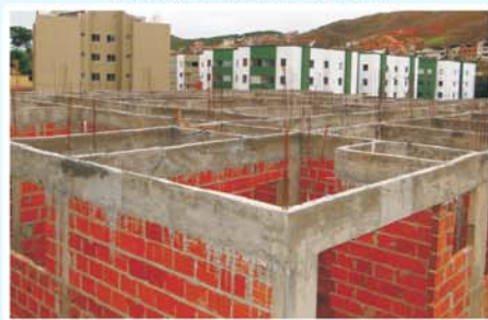
Construção de moderno PSF no bairro Triângulo