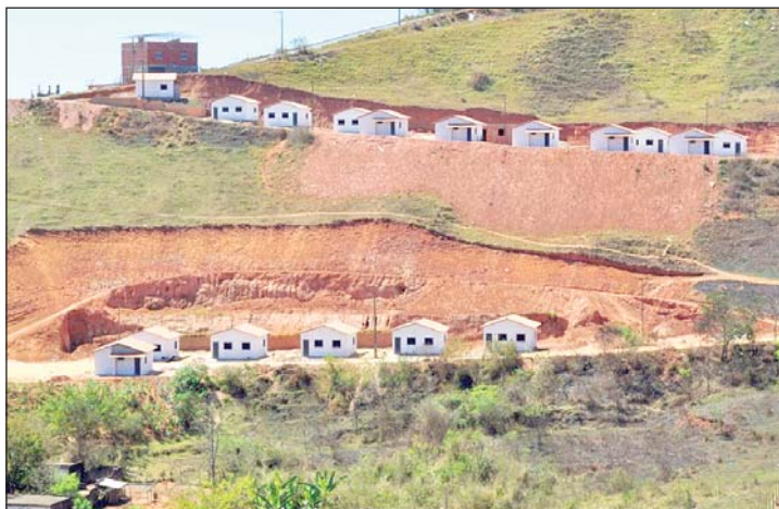
Programa Minha Casa Minha Vida, no Bom Pastor, que pode ganhar mais 60 moradias: leia na página 7

Já o vereador afirmou na Câmara, em 21/11, que "só após minhas denúncias o Setor de Fiscalização cobrou das empreiteiras informação sobre o andamento das obras na cidade e até