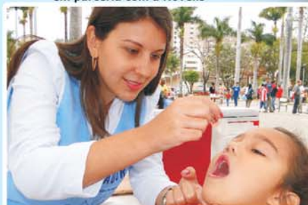
Cuidando das crianças. Garantido o futuro!