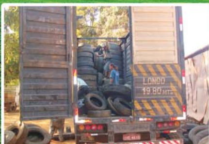
Ecoponto: destino correto para pneus inservíveis