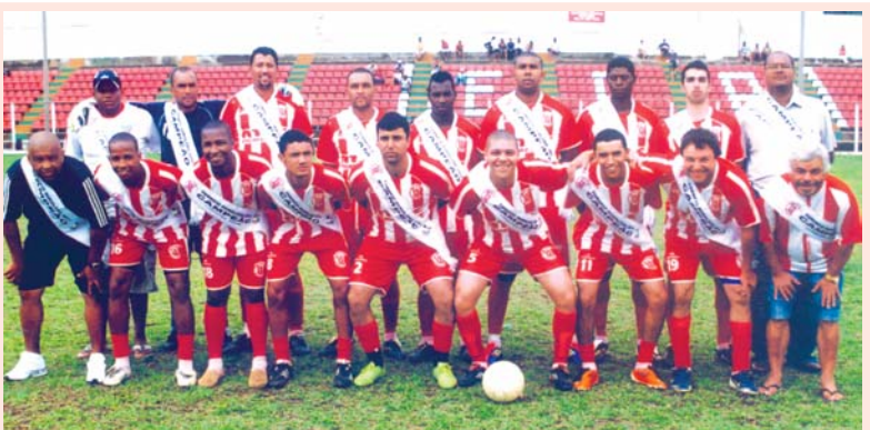
Faixa de campeão - Estes são os atletas do time de Vau-Açu, campeões titulares do Ruralzão 2011. As faixas foram entregues em amistoso de 15/11, no Estádio do Pau d’Alho.

Somente em 4/12, em Amparo do Serra, acontece a 1ª partida da final do Campeonato de Futebol Regional do Açúcar Sub-20, entre os times de América do Serra e Urucânia. A rodada está adiada porque amanhã, sábado (26/11), e domingo (27/11) ocorre a Festa de Nossa Senhora das Graças, padroeira urucaniense. O time de Urucânia/9pg se classificou em 12/11 vencendo o Riococense por 2 x 0. Na mesma data, tivemos América WO Jequeri (este chegou atrasado em campo), com o time serrense garantindo a vaga final com 9pg. Já em 20/11, cumprindo tabela, Ana Florência/7pg venceu América por 1 x 0. Na mesma data, cancelou-se o jogo entre Jequeri x Riococense, que não mais interferiria na classificação final.