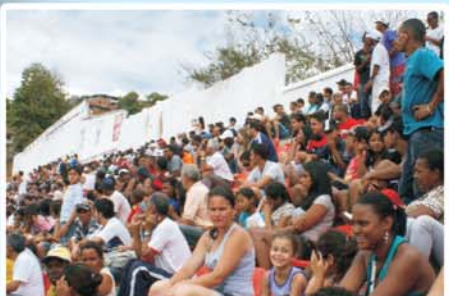
Ruralzão 2011: o futebol une famílias e desenvolve o esporte