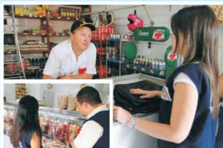
Vigilância Sanitária: ação independente, profissional, educativa e coerente