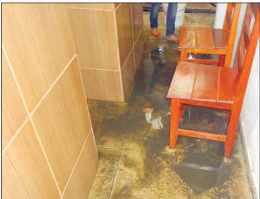
Água de chuva (com o esgoto jogado no córrego Passa-Cinco) retornou, em 23/11, dentro de algumas lojas do centro de Palmeiras localizadas acima da canalização do citado córrego. Os comerciantes cobram providências da Prefeitura