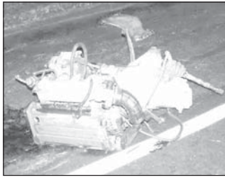
Acidente fatal em Raul Soares: no detalhe, o motor arremessado na pista