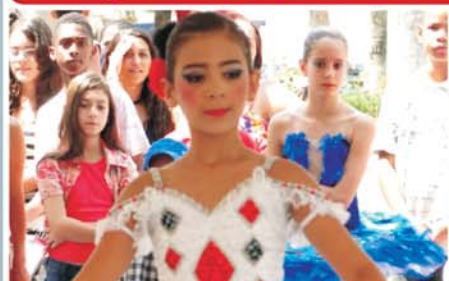
Ponte Nova em Dança: "O maior evento artístico do Vale do Piranga"