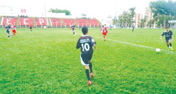
Lance do jogo mirim A entre ECP e Acaiaca

- Na rodada de 20/11 do Campeonato Intermunicipal de Futebol de Base da Liga Municipal de Desportos/LMD-PN, o Esporte Clube Palmeirense/ECP recebeu o time de Acaiaca. Na categoria mirim B, houve empate (1 x 1), e o ECP venceu nos jogos mirim A (9 x 0) e infantil (3 x 1). Jequeri recebeu o Pontenovense e empatou na categoria mirim B (1 x 1) e perdeu nos confrontos mirim A (4 x 1) e infantil (2 x 1).