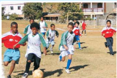
Esporte pela Vida: ações governamentais integradas entre a Assistência Social/CRAS e SEMCEL