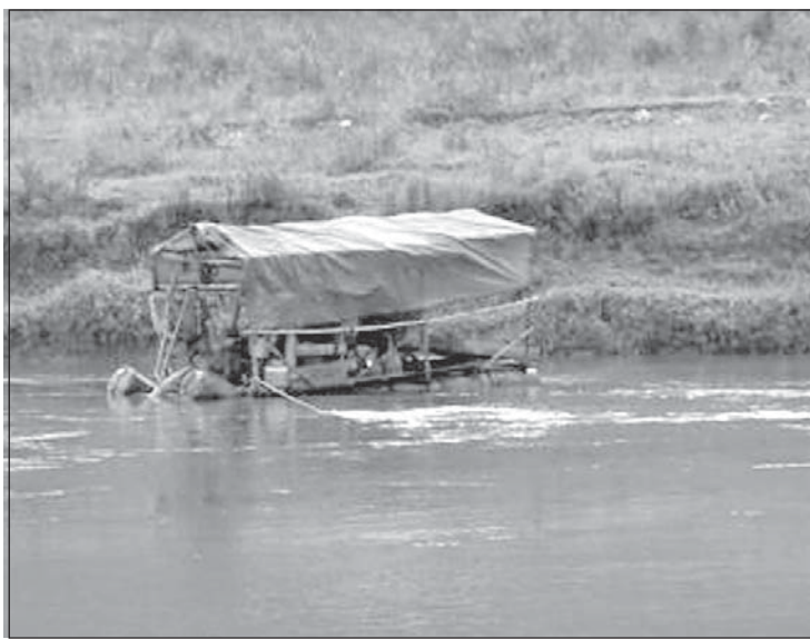
A draga no rio: multa de R$ 3,5 mil após o flagrante

SÃO PEDRO DOS FERROS - Mário Eleutério Quirino, 53 anos, foi multado em R$ 1,8 mil pela PMMA em 7/10, por dano ambiental em área de 0,07 hectare (ha) em sua propriedade, no Córrego da Mata. Cópia da ocorrência foi encaminhada à Delegacia de Polícia local.