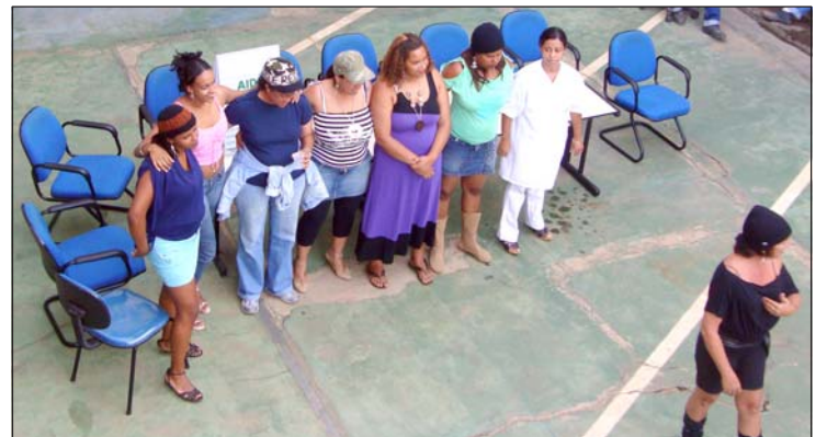
Os funcionários participaram de reuniões e palestras no auditório (ao lado). No pátio, teatro sobre prevenção contra a Aids

Nos dias seguintes reeditaram-se as agendas de DDS, SGL, certame de truco e treinamento do MSSOMA. Paralelamente à Sipat, o Dmaes promoveu concursos de desenho e redação com o tema "Água: