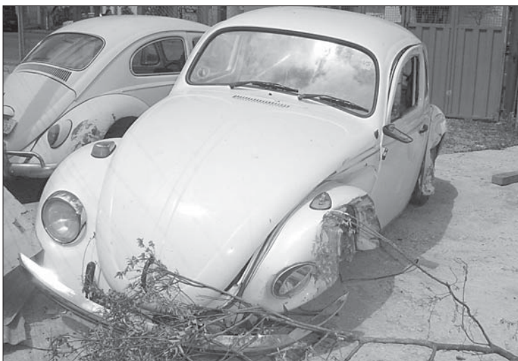
O Fusca danificado após a colisão contra um Monza na MG-262