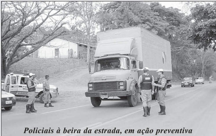
Policiais à beira da estrada, em ação preventiva

Ainda segundo a PRE, expediram-se 111 multas para motoristas e motociclistas, sendo os casos mais comuns os de falta de extintor de incêndio, problemas elétricos nos veículos, ocupantes dos veículos sem cinto de segurança, entre outros. Houve flagrante de 24 inabilitados e 3 prisões por documentos suspeitos e por transporte ilegal de passageiros. Registraram-se, ainda, apreensão de 2 CNHs: uma de pessoa que dirigia após o uso de