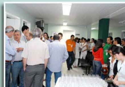
Parte do público que prestigiou o evento

Esta é mais uma conquista do HAG para você!