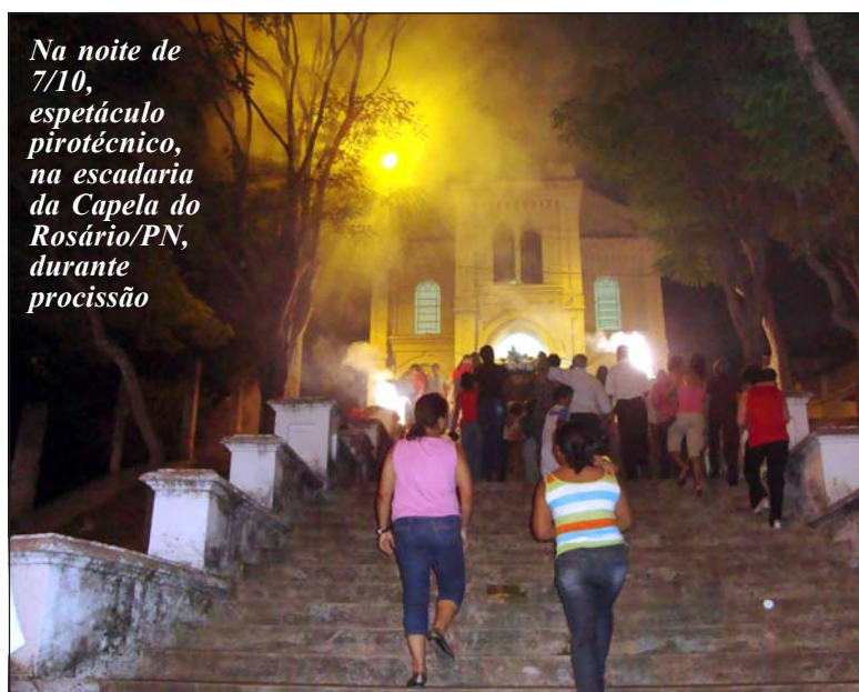
Na noite de 7/10, espetáculo pirotécnico, na escadaria da Capela do Rosário/PN, durante procissão

Os católicos de PN celebraram em 12/10 o Dia de Nossa Senhora Aparecida/Padroeira do Brasil,