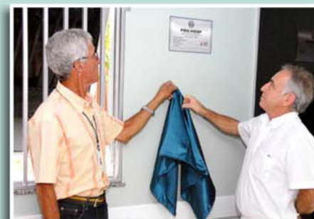
Descerramento da placa