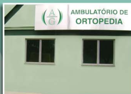
Fachada do ambulatório