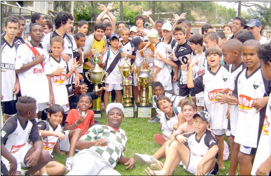
Jogadores e comissão técnica do ECP com os 3 troféus conquistados