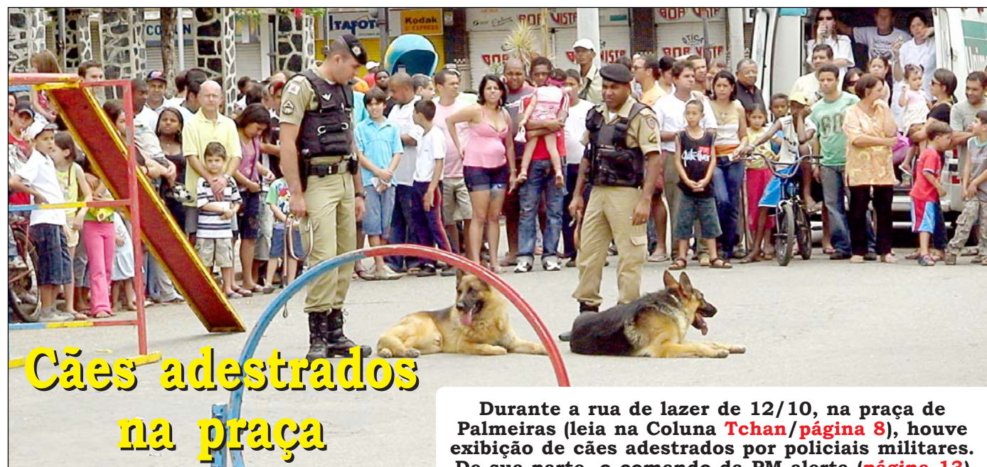
Cães adestrados na praça

Nos próximos dias, a Equipe de Transição começa a atuar, preparando a mudança de comando na Prefeitura/PN. Surgem os 1 os nomes indicados pelo prefeito eleito, Joãozinho Carvalho/PTB