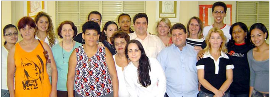
A equipe da Faculade Dinâmica com a Coordenação de Pastorais