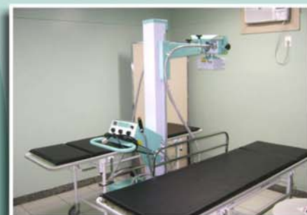
Novo equipamento de Raio- X