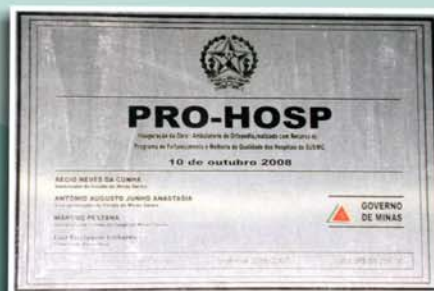
Placa de inauguração

O Ambulatório fica na rua Sebastião Francisco de Oliveira, Guarapiranga. (Anexo ao hospital).