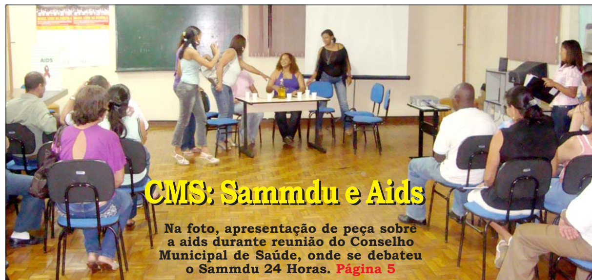
CMS: Sammdu e Aids

Na foto, apresentação de peça sobre a aids durante reunião do Conselho Municipal de Saúde, onde se debateu o Sammdu 24 Horas. Página 5